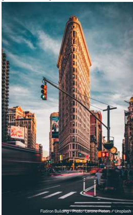
Flatiron Building - Photo : Lerone Pieters / Unsplash

Les immeubles Maison Gobineau à Bordeaux et Flatiron Building à New York sont liés par leur géométrie, due à la forme triangulaire des parcelles sur lesquelles ils ont été construits.