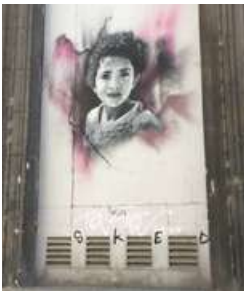
Street Art à Bordeaux