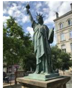
Maison Gobineau et statue de la Liberté à Bordeaux