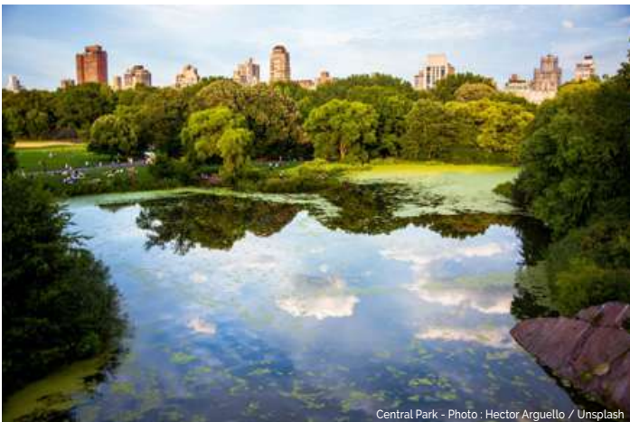
Central Park - Photo : Hector Arguello / Unsplash