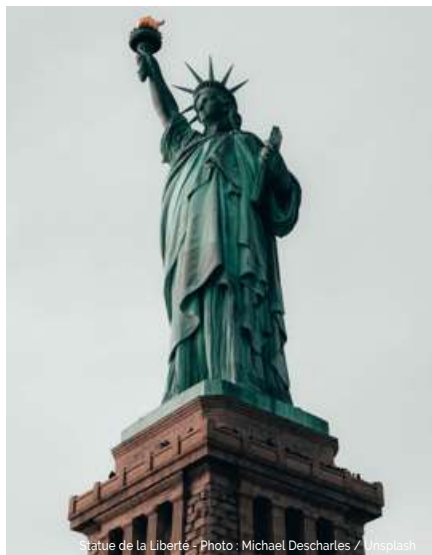
Statue de la Liberté

À New York, et sur le reste de la planète, tout le monde la connaît. De lames de bronze vêtue, « La Liberté éclairant le monde » fut offerte par la France. Conçue par Frédéric-Auguste Bartholdi et montée sur une armature d'acier de 33 m de haut dessinée par Gustave Eiffel, elle fut inaugurée en 1886.