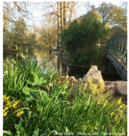
Jardin Public