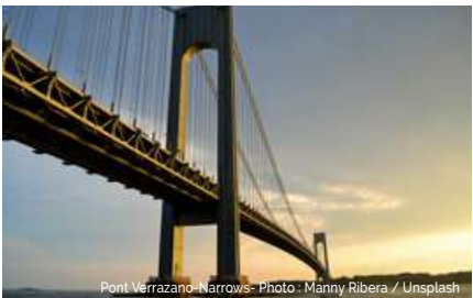
Pont Verrazano-Narrows