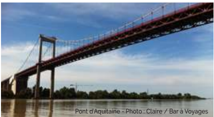
Pont d'Aquitaine

New York, construite autour de cinq boroughs, compte de nombreux ponts dont le pont Verrazano-Narrows, célèbre grâce au Marathon de New York. À Bordeaux, le pont d'Aquitaine est le deuxième pont construit après le pont de Pierre. Même si leur taille n'est pas comparable, puisque le