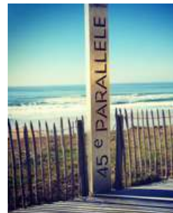
45 e parallèle

Beaucoup moins poétique, l'immeuble new-yorkais Flatiron Building (traduisez, l'immeuble fer à repasser) se situe dans le quartier de Midtown à Manhattan. Avec son architecture originale d'apparence fragile, il