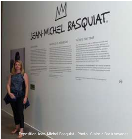
Exposition Jean-Michel Basquiat

ses toiles est également exposée dans le bureau du président à l'Élysée ? Aujourd'hui, le street art reste très présent, particulièrement dans le quartier de Brooklyn.